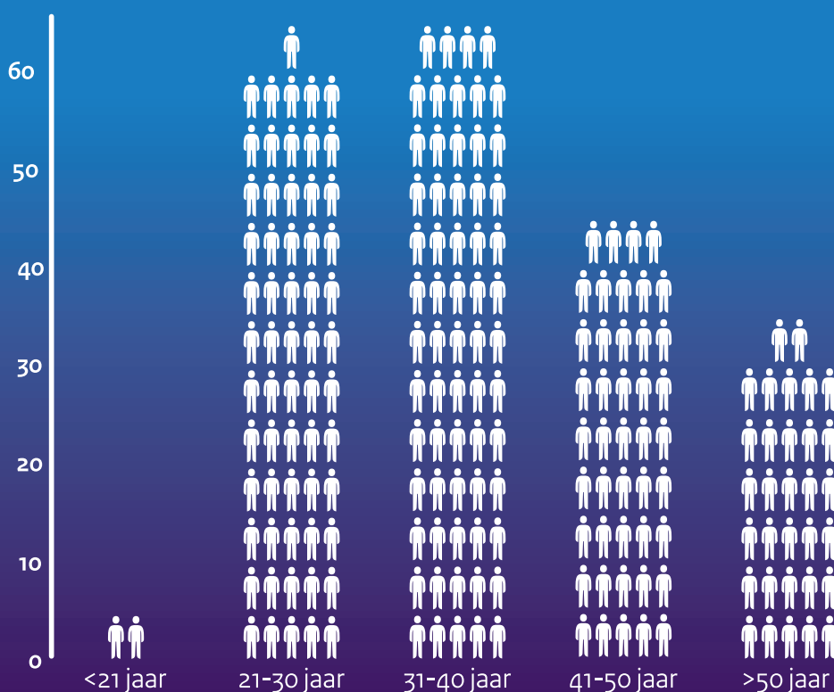
Figuur 3 Leeftijd slachtoffers liquidaties 2013-2021

De meeste liquidaties zijn gepleegd in Noord-Holland, met name in Amsterdam. Daarna volgt Zuid-Holland. Daar gaat het in het merendeel van de gevallen om Rotterdam als pleegplaats. In 2021 is de helft van het aantal liquidaties (4) in de hoofdstad gepleegd en bijna de helft (3) in Zuid-Holland.