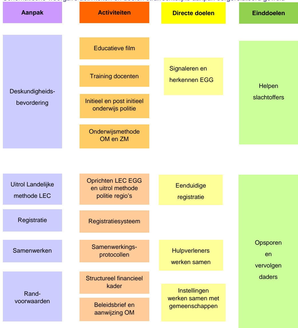
Figuur 3.1 Schematische weergave activiteiten en doelen strafrechtelijke aanpak eergeerelateerd geweld