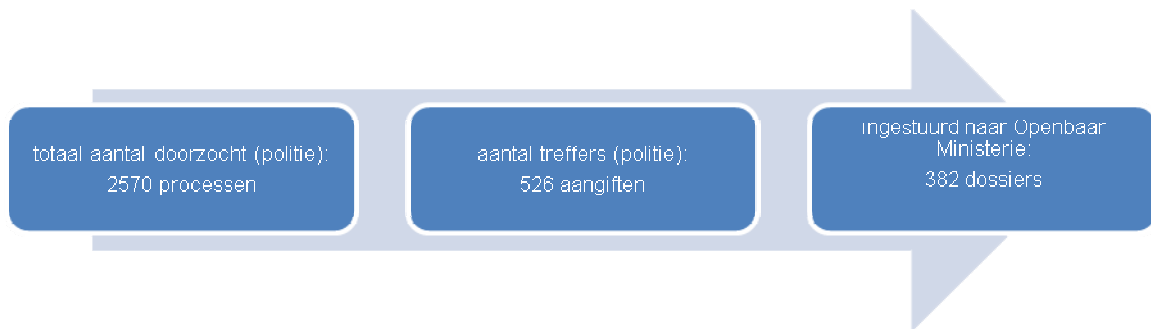
Figuur 1. Aantal processen en dossiers kindermishandeling

De verkregen aantallen processen-verbaal van aangifte in de elf politieregio's zijn gecontroleerd op validiteit door andere bronnen te gebruiken, zoals de eigen registraties van de politieregio's, Rechtspraak.nl en door een controle op door de politie afgeschermdde zaken. Het resultaat van deze controles was dat een aantal processen in de zoekvraag niet naar voren kwam (door onder andere fouten bij de registratie van processen).