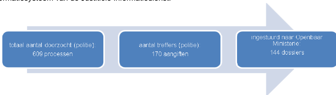
Figuur 2. Aantal processen en dossiers van partnergeweld met kinderen als getuige

Voor het onderwerp 'partnergeweld met kinderen als getuige' zijn 609 processen in elf politieregio's ingezien. Bij 170 processen was (daarbij ook sprake van een aangifte) Van deze 170 aangiften waren er 144 ingestuurd (= 85%) naar het Openbaar Ministerie en deze waren traceerbaar binnen het informatiesysteem van de Justitiële Informatiedienst.